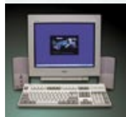
Option de programmation PC. Compatible avec le système centralisé de contrôle de gestion de l'arrosage IMMS