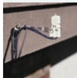
Compatible avec sondes météorologiques