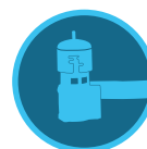
Sonde Mini-Clik Page 145