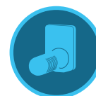
Sonde Freeze-Clik Page 152